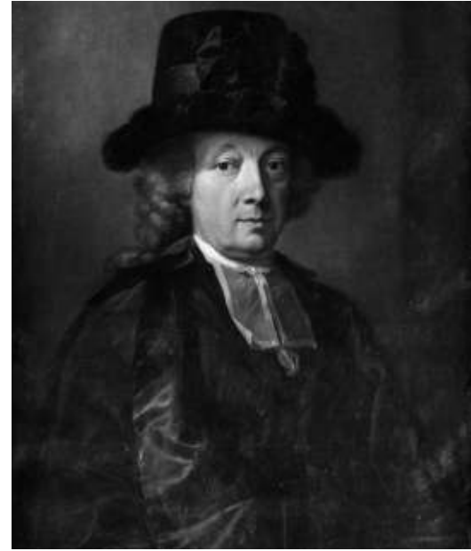
Rechtes Bild: Niklaus Emanuel von Tscharnher (1727 – 1794) war von 1767 – 1773 Landvogt des Amtes Schenkenberg. In seiner «Physisch-ökonomische Beschreibung des Amtes Schenkenberg» vermittelte er ein gutes Bild über den Weinbau in der Gegend von Brugg zu seiner Zeit (Stiftung Schloss Jegenstorf; Foto: Burgerbibliothek Bern, Porträtdok. 6414)

Tatsächlich wurden die traditionelle Laubarbeit und Bodenbearbeitung, so wie sie Rhagor beschrieben hatte, erst ab Mitte des 20. Jahrhunderts mit der konsequenten Umstellung auf Drahtbau und der Begrünung der Rebberge abgelöst.