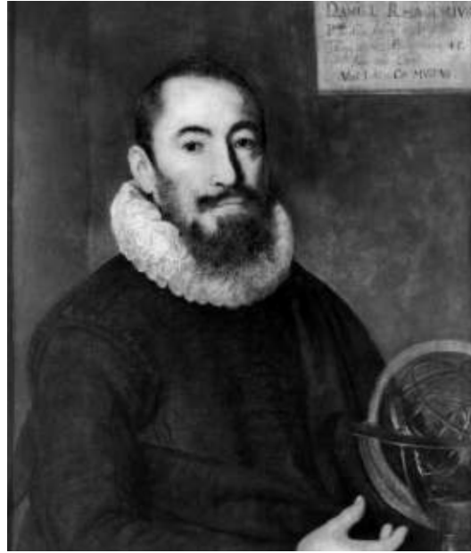
Linkes Bild: Der Brugger Daniel Rhagor (1577 – 1648) war der erste, der mit seinem «Pflantz-Gart» eine deutschsprachige Anleitung für den Obst-, Kräuter- (Gemüse-) und Weinbau herausgab. Das Werk hatte grossen Erfolg und erschien in mehreren Auflagen