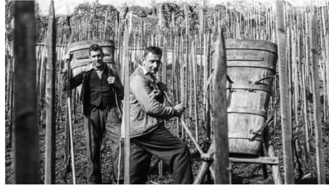
Erde und Mist, auf dem Rücken in den Rebberg getragen

Mit dem Vergruben wurden, wie Kohler schrieb, über Jahrhunderte immer wieder die gleichen Reben verjüngt. Die Sortenverhältnisse waren damit äusserst stabil. 13 So lassen sich aus späteren Sortenangaben Rückschlüsse auf die Sortenverhältnisse im 17. und 18. Jahrhundert ziehen.